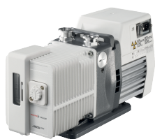
Pascal 1015 , SD 版本 , 单相电机 , 180 – 254 V, 50 Hz/60 Hz , CE/UL/CSA