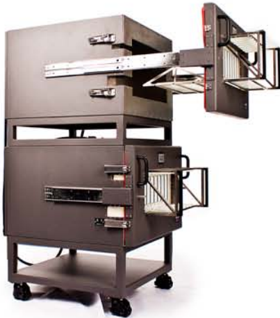
PCB batch production