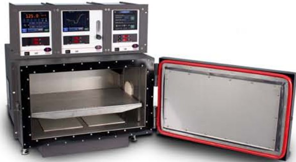
avionics systems production