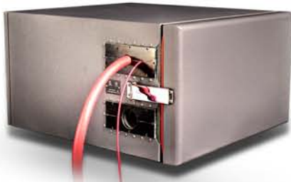
guidance telemetry systems